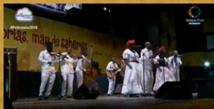
FESTIVAL DE MÚSICA DEL PACÍFICO PETRONIO ÁLVAREZ 2018