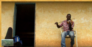
MI COMPADRE NO SE VA