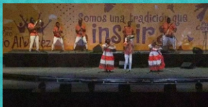
FESTIVAL DE MÚSICA DEL PACÍFICO PETRONIO ÁLVAREZ 2021