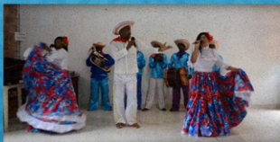
ZONALES - FESTIVAL DE MÚSICA DEL PACÍFICO PETRONIO ÁLVAREZ